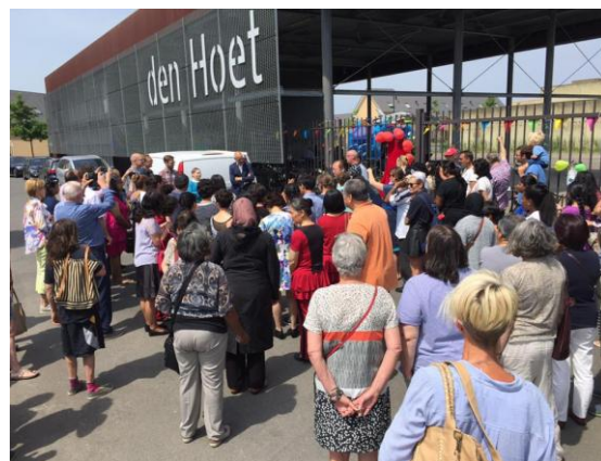
Bewoners in Leidsche Rijn bij de opening