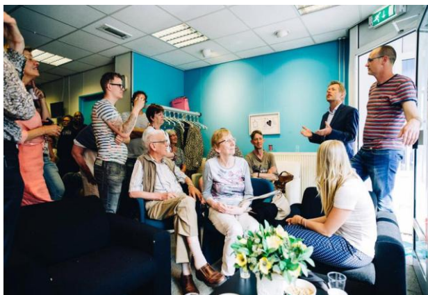
Bewoners buurtwerkkamer TOP bij de opening