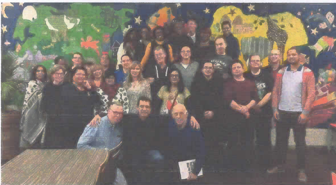
De eerste ledenvergadering van onze coöperatie in 2016.