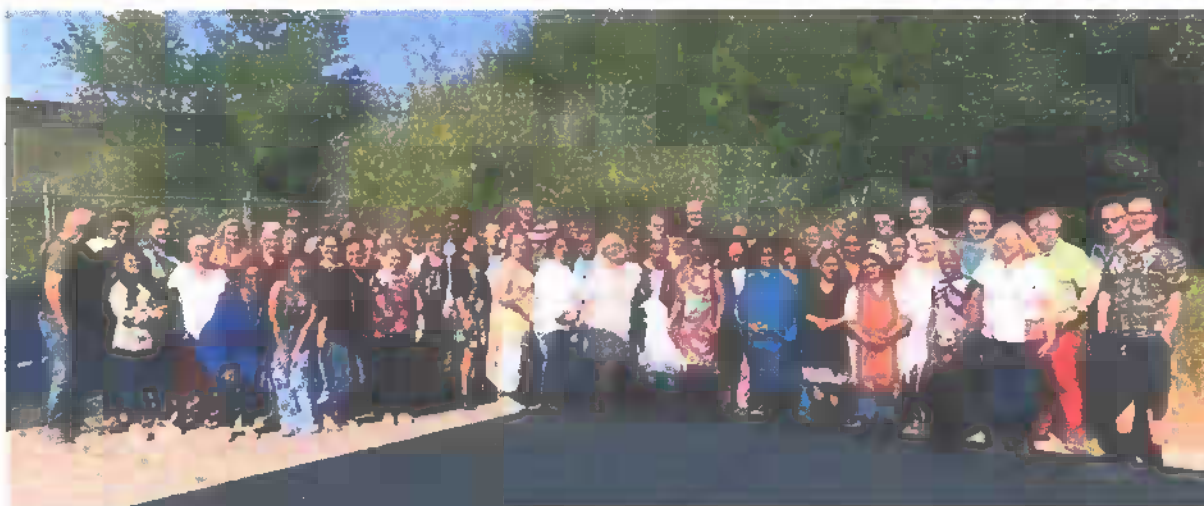
Op de foto: 57 leden, vrijwilligers en medewerkers - sommigen staan er niet op, o.a. het 'kookteam'.

Locatie: buurtwerkkamer 'Hart voor Leidsche Rijn' aan de Belcampostraat 12 in Utrecht